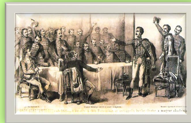
1. ábra Széchenyi felajánlása

Már az 1791. évi országgyűlés tudományi bizottsága is felvette programjába a katonai és a képzőművészeti akadémián kívül egy Magyar Tudományos Akadémia 1 felállítását. Az 1825-ös reformországgyűlésen (a követek november 2–3-ai kerületi ülésén) ennek az ötletét ismét felelevenítették. Már az első gyűlésen szóvá tette az intézmény szükségességét Máriássy István, Gömör vármegyei követ, de különösen nagy hatása volt Felsőbüki Nagy Pál beszédének, amelyben hevesen kikelt azon elkorcsosodó főurak ellen, akik elhanyagolták a magyar nemzet és a magyar nyelv érdekei. Ezt követően Széchenyi is felszólalt: „Én szavazattal nem bírok, én nem vagyok országnagy, de földbirtokos. Ha egy intézet álland fel a magyar nyelv kifejlesztésére, mely polgártársaim nevelését is elősegíti, úgy felajánlom egy évi egész jövedelmemet, mely 60.000 forintból áll, s az a felállítandó magyar tudós társaság alapjához csatoltassék.”