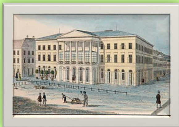
2. ábra A kaszinó épülete